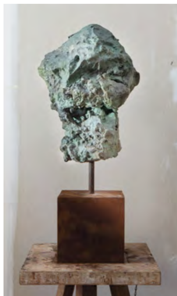
EL BIAR, Bronze 1/7, 77x33.