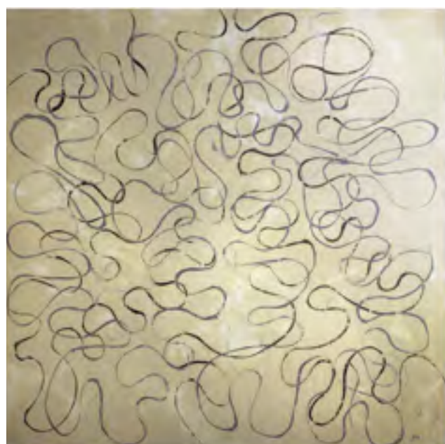
FIGURA SERPENTINA, Acrylique sur toile, 190x190.

En fait, Martinez s'agite, se débat dans l'épaisseur du réel, essaie de ne pas se laisser engloutir par la marée toujours montante des événements, comme nous le faisons tous, mais c'est le rôle des artistes que de nous montrer cette lutte. Pour nous donner du courage, sans doute.