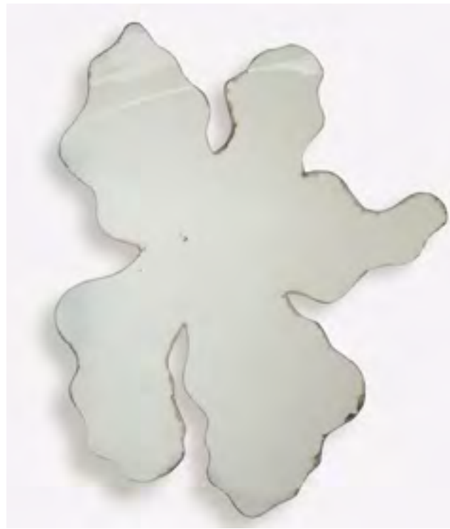
FLEUR BLANCHE 2, Tôle automobile, 130x90.