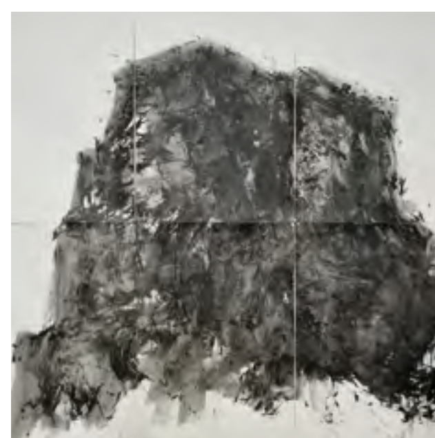
BAOU CHINOIS, Encre et acrylique sur papier marouffé, 150x140.