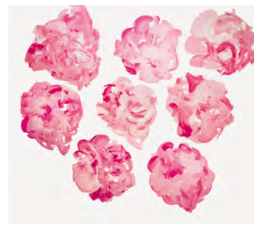
TANGO XII.LXMMXV, Acrylique sur toile, 200x200.

INFORMATIONS COMPLEMENTAIRES, BIOGRAPHIES, EXPOSITIONS, CATALOGUES... www.jacquemartinez.com