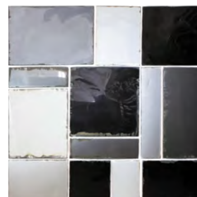
OPUS ROMANUM, Tôle automobile, 200x200.