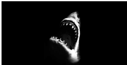
Untitled (Shark 9) , 2008

HERO , 1983. Technique mixte, collage et acrylique.