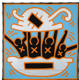
Untitled (n° 2557)

Exemple avec Untitled N°2557 , 1986. Dessin à la peinture sur toile.