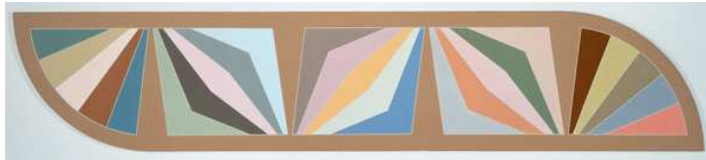
Damascus Gate II , 1969

Exemple avec Damascus Gates II , 1969. Huile sur toile, organisations géométriques de couleurs pures.