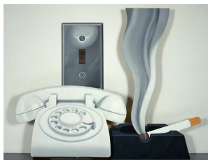
Still life # 56, 1967-1969

Exemple avec Still Life # 56, 1967-69 . Huile sur toile, représentation d'objets d'intérieur.