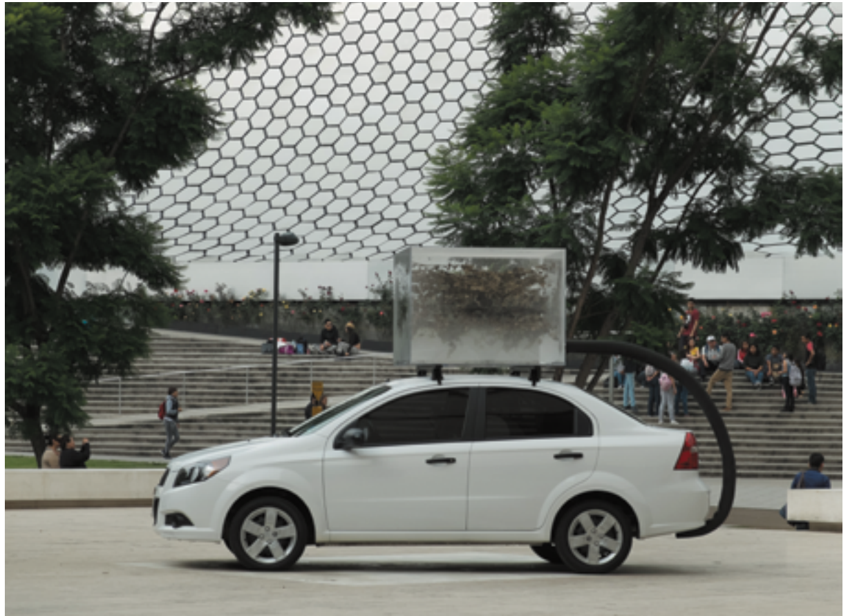
Gustav Metzger, Mobile, 2015, Mexico, Fundación Jurex Arte Contemporáneo

MAMAC Musée d'art moderne et d'art contemporain