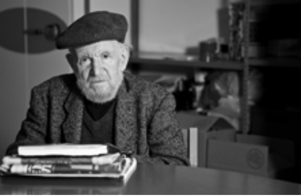
Remember Nature : A Call to Action by Gustav Metzger Serpentine Galleries, Central St Martins, UAL 4 November 2015

Acteur majeur des avant-gardes de la seconde moitié du XX e siècle, Gustav Metzger a contribué, dès la fin des années 1950, à la redéfinition de l'art. L'artiste explore en effet de nouvelles modalités de création : manifestes, performances, œuvres éphémères à réaliser d'après instructions, appel à participation du public, intérêt pour des œuvres en processus et soumises à métamorphose, etc.