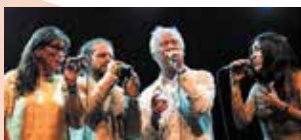
Groupe Corou de Berra

A capella est un spectacle de chants polyphoniques des Alpes du Sud, présenté par le groupe Corou de Berra. Leur répertoire, en perpétuelle évolution, va du chant traditionnel des Alpes de Méditerranée dans sa plus pure expression jusqu'aux créations contemporaines les plus inattendues. Musique jamais figée, interprétée avec toute la vivacité requise, par des chanteurs en pleine possession de leur culture et de leur art.