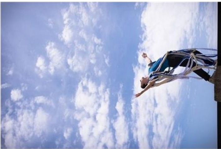
La Compagnie Humaine, © Eric Oberdorff.

20H RENCONTRE , dans la passerelle du 3 ème étage