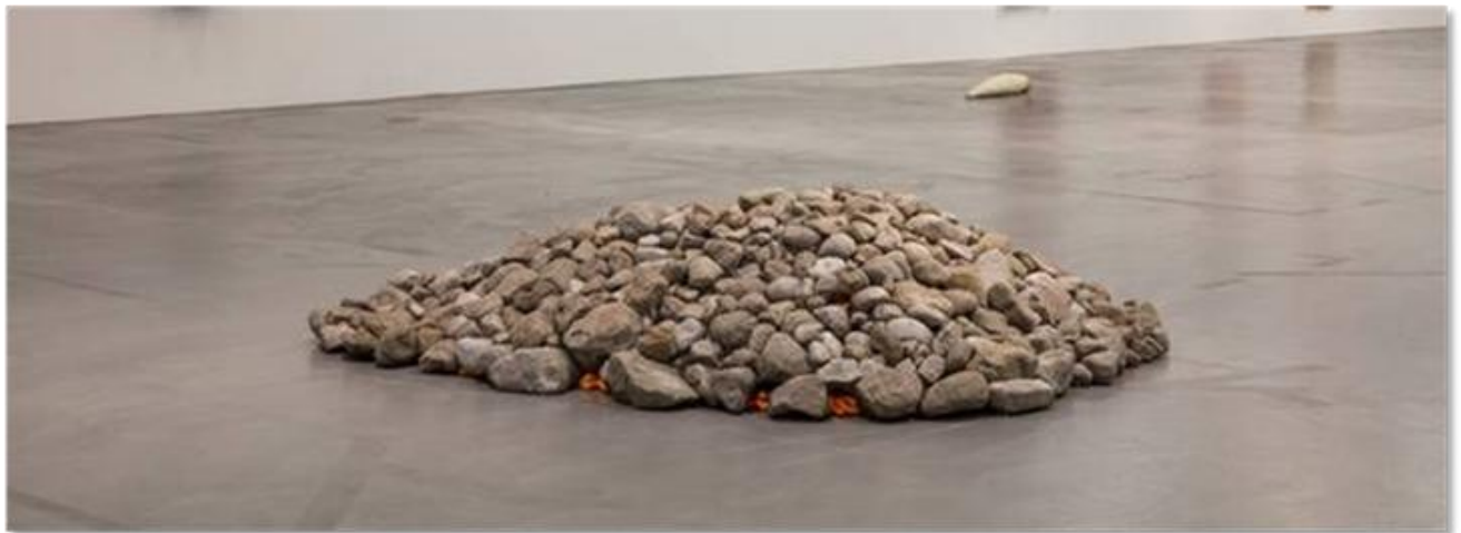
Liz Magor, Chee-to , 2000

Tarif unique 6 euros – gratuit pour les - de 13 ans